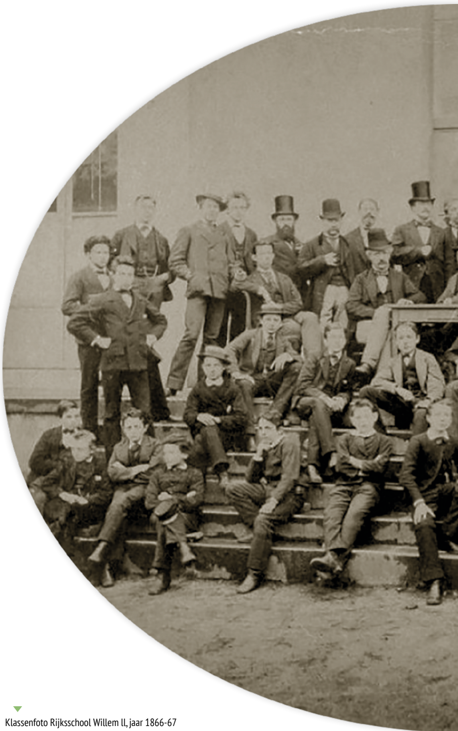
▼ Klassenfoto Rijkschool Willem II, jaar 1866-67