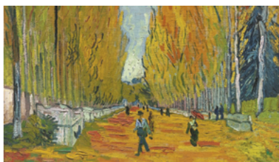
L'Allée des Alyscamps, een begraafplaats uit de Romeinse tijd in Arles die Vincent van Gogh in 1888 schilderde.