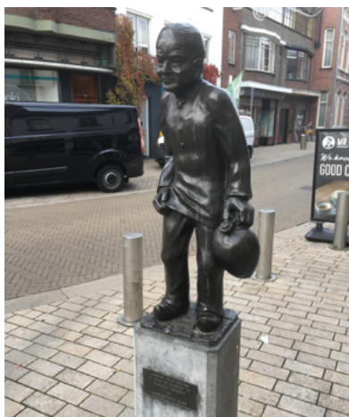
De Kruikenzeiker in de Nieuwlandstraat

Aan het begin van de Nieuwlandstraat staat een beeldje van de Kruikenzeiker , een bijnaam voor de Tilburgers. Deze geuzennaam is volledig gerelateerd aan het verleden van Tilburg als textielstad. Tot de introductie van chemische middelen was menselijke urine (zeik) noodzakelijk bij het wassen, verven en vollen van wol. Dat de Tilburgers daarvoor hun urine gebruikten, is onomstotelijk bewezen. Voor het letterlijk plassen in een kruik bestaat geen