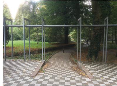
Stadspark de Oude Dijk.