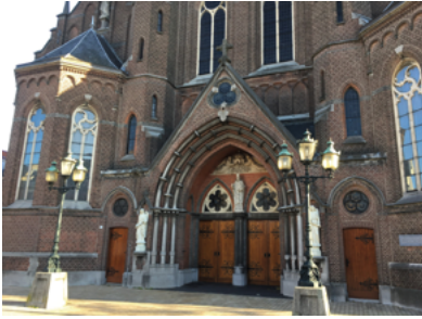
Hoofdingang van de Heikese kerk en engelenbeeld.