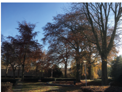
Het Zomerpark aan de Zomerstraat.

Het parkje rechts, Zomerpark genaamd, is de voormalige tuin van fabrikantenfamilie Sträter. Er staan vele sierplanten in, een treurbeuk, een kurkboom en een grote, witbloeiende magnolia. Bij de fontein staat een bijzondere boom, namelijk de blauwbloeiende Anna-Paulownaboom, genoemd naar de gemalin van koning Willem II. Tegen de parkeergarage staan enkele boomhazelaars.