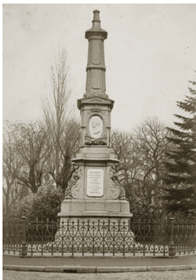
De oude gedenknaald in 1920.

Naast het Paleis-Raadhuis staat Stadskantoor 1 , gebouwd in 1971 naar ontwerp van architect