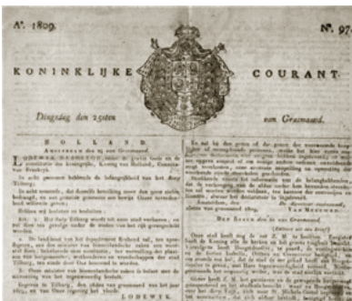
De Koninklijke Courant van 25 april 1809, waarin de officiële aankondiging dat Tilburg op 18 april tot stad werd verheven.