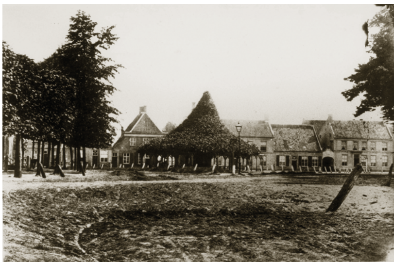
De Heuvel in 1860.