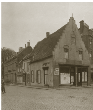
De hoek van de Zomerstraat (thans Heuvelstraat) en Nieuwlandstraat met bakkerij 'De Oude Ster' uit 1618. Hier liep Vincent vaak langs. Bij de bomen de Nederlands Hervormde kerk.

Rond 1900 werd het verenigingsgebouw Nieuw Leven van de Nederlands Hervormde Gemeente en van 1968-2004 was het in gebruik bij de Stichting Sociaal Cultureel Centrum Terra Nova, een van oorsprong protestantse culturele instelling die voor een breed publiek zeer diverse cursussen organiseerde.