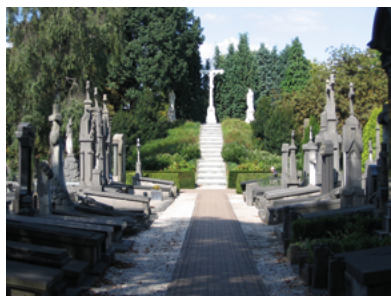
Begraafplaats Binnenstad aan de Bredaseweg.