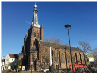
De Heikese kerk en de gedenknaald van koning Willem II.

De kerk heeft een prachtig interieur. Pronkstukken zijn onder meer het orgel (uit 1776), het hoogaltaar (1699-1700), het doopvont (1874), de kruiswegstaties (1890-1898) en de vele heiligenbeelden en glas-in-loodramen. In de toren hangt nog een klok uit 1654. Het interieur van dit rijksmonument werd in 1996 gerestaureerd.