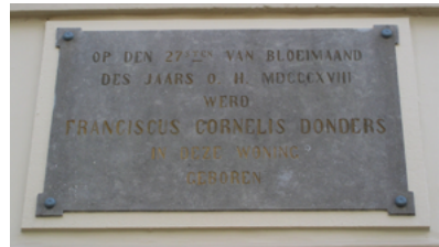
Gedenksteen van prof. dr. F.C. Donders in pand Nieuwlandstraat 44.

ambt als hoogleraar neer. Bij deze gelegenheid werd in zijn geboortehuis een gedenksteen boven de voordeur aangebracht, waarvan de tekst ontworpen werd door dr. Nicolaas Beets (1814-1903):