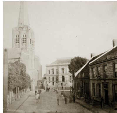
De (Oude) Markt met Heikese kerk en stadhuis. Foto uit de tijd van Vincent, omstreeks 1860.