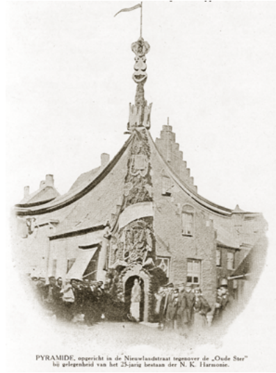
PYRAMIDE, opgericht in de Nieuwlandstraat tegenover de „Oude Ster“ bij gelegenheid van het 25-jarig bestaan der N. K. Harmonie.