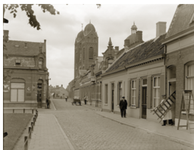
Het Lieve Vrouweplein in 1935. De lage huisjes rechts waren er ook al toen Vincent op Korvel woonde.