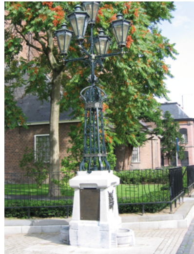
Lantaarn en drinkfontein uit 1904 (tijdelijk verwijderd).