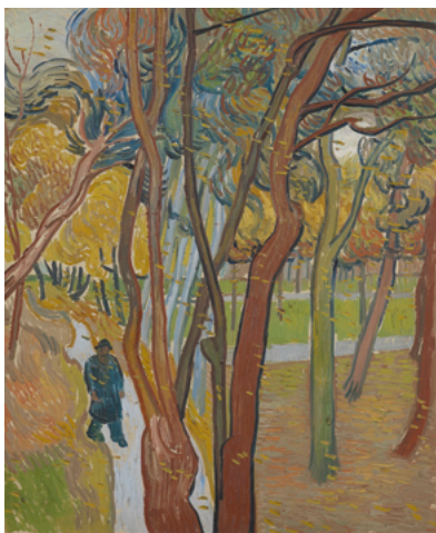
Vincent van Gogh, De tuin bij het Saint-Paul Hospital in Saint-Rémy-de-Provence, 1889.