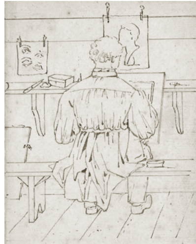
Schets van tekenleraar C.C. Huijsmans van een van zijn leerlingen. (Coll. Stadsarchief Breda)