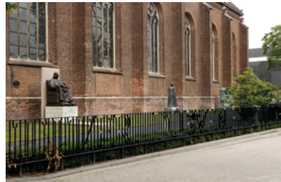
Plantsoentek bij de Heikese kerk.

Tegen de zijkant van de Heikese kerk is een klein plantsoen omgeven door een hekwerk uit 2005 met daarin twee teksten die repeterend zijn verwerkt: MANSUETE ET FORTITER (zachtmoedig en sterk), de lijfspreuk van bisschop Zwijsen, en DURVEN EN DULDEN. Zwijsen was van 1832-1854 pastoor van