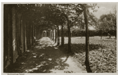
De Antoniuslaan in de tuin van de Zusters, 1930.