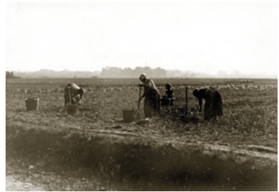
Aardappelrooien aan de Bredaseweg in 1903.

zijn verkeersisollement. In 1866 telde de stad 35 door stoomkracht aangedreven wollenstof-fabrieken en er waren 2.350 thuiswerkers voor de wollenstoffenindustrie werkzaam. De meest voorkomende beroepen waren wever en fabriekswerker. Op afstand volgden landbouwer, schoenmaker, timmerman en fabrikant. De leeftijdsgenoten van Vincent waren werkzaam in de industriële, ambachtelijke of agrarische bedrijven en bedrijfjes. Kinderarbeid was normaal in die tijd. Toen Vincent hier in 1866 met de trein op het station arriveerde, werd de stad geplaagd door de ergste choleraepidemie uit de negentiende eeuw, die hier 41 dodelijke slachtoffers maakte. In september en oktober 1866 was de ziekte op zijn hevigst.