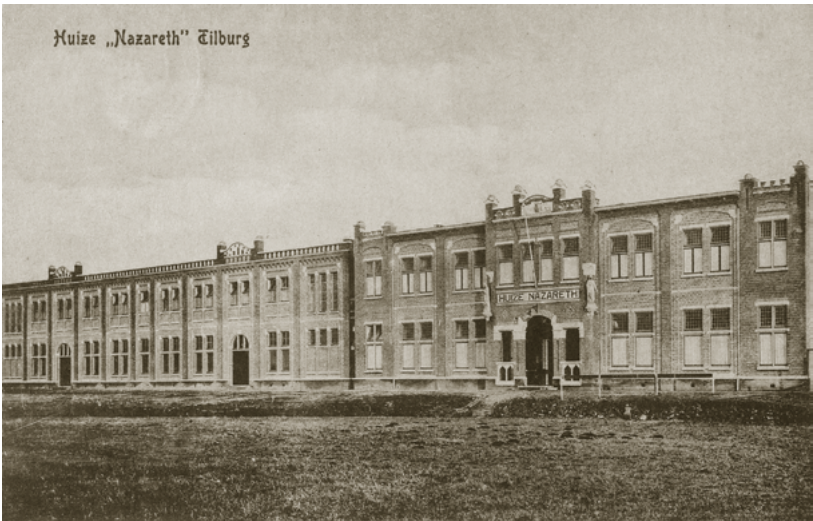
Huize Nazareth in 1916.

Route: Loop door parkje en op het einde rechtsaf de Kloosterstraat in.