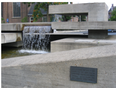
Bronzen gedenkplaat koning Willem II op de zijkant van de fontein van Jooop Beljon.

Op 17 maart 1874, 25 jaar na het overlijden van koning Willem II, werd er op de plaats waar zijn sterfhuis heeft gestaan een 12 meter hoge hardstenen gedenknaald, naar ontwerp van architect Hendrik van Tulder, opgericht. Deze gedenknaald werd in 1933 enkele meters verplaatst en in 1968 afgebroken ten behoeve van de aanleg van het Stadhuisplein en de Paleisring. In 1982 is er een bronzen herinneringsplaquette aangebracht op de zijkant van de betonnen fontein van kunstenaar Jooop Beljon (1922-2002). Hij ontwierp overigens in 1973 ook de twee betonnen abri's die aan de achterzijde van het paleis aan beide zijden van de Paleisring stonden. Er staat er thans nog maar één aan de zijde van appartementencomplex de Frankenhof.