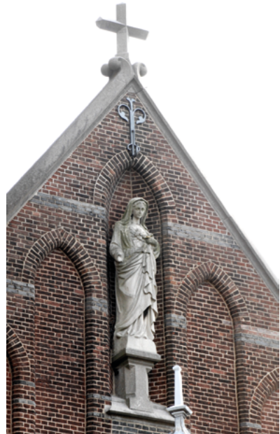
Het beeld van O.L. Vrouw van het H. Hart