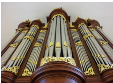
Het uit 1765 daterende Bätz-orgel in de Pauluskerk.