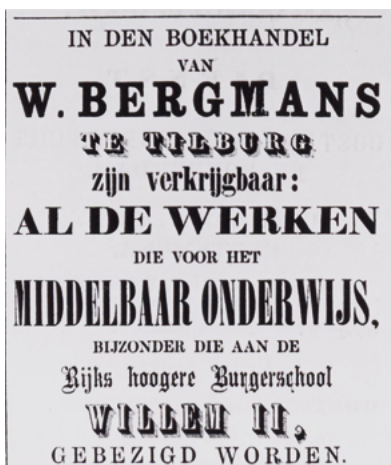
Advertentie in het Weekblad van Tilburg van 31 maart 1866