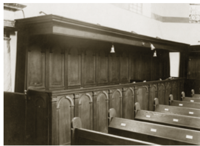
De zogenaamde Koningsbank van Willem II en Anna Paulowna in de Nederlands Hervormde Pauluskerk, 1934. Vincent zal er vol ontzag naar hebben gekeken tijdens de kerkdiensten die hij daar bijwoonde.