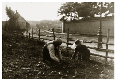
Arbeid op het land bij de kloostermuur van de Zusters van Liefde aan de Nieuwstraat omstreeks 1900. Klooster en kloostertuin lagen nog midden in de velden.

Er waren 64 personen aangetast, van wie er 33 overleden. De kermis, vermoedelijk de besmettingsbron, werd dat jaar afgelast. Waterleiding en een behoorlijk rioolstelsel ontbraken, en dat was niet bevorderlijk voor de gezondheid. In Tilburg werd het rioolstelsel pas vanaf 1870 aangelegd.