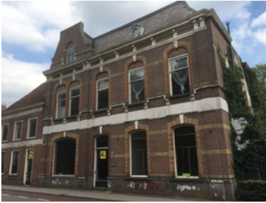
Voormalig klooster van de Franciscanessen.