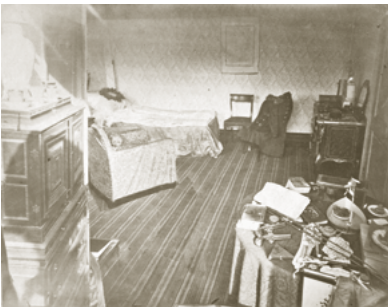
De sterfkamer van koning Willem II