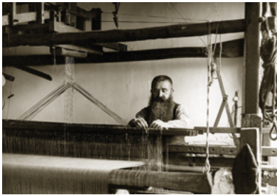
Tilburgse thuiswever in 1901.

(Brief 082: Vincent van Gogh aan zijn broer Theo van Gogh, Ramsgate, 12 mei 1876)