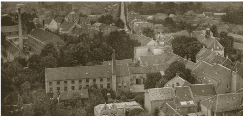
Panoramafoto vanaf de Heikese kerk met rechts de Hervormde kerk en vooraan de wollenstoffenfabriek J. de Beer Azn., links daarachter (in U-vorm) wollenstoffenfabriek B.Th.C. Sträter en vervolgens de wollenstoffenfabriek F.M. Sträter ('De Zomermolen'), 1930.

En achter het kosthuis stond de wollenstoffenfabriek van Sträter. Op zijn weg van het station naar het kosthuis kwam hij in de Stationsstraat langs de fabriek van Ledeboer, die vanaf 1853 met stoomkracht werkte.