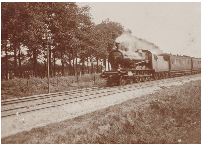
De spoorlijn aan de Bosscheweg, 1910.