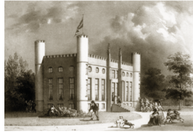
Het koninklijke paleis in 1849.