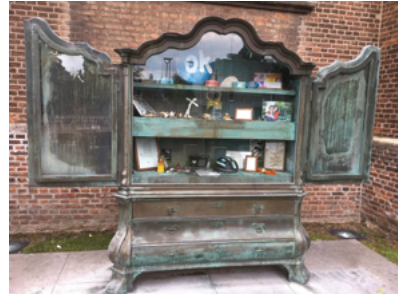
Monument tegen zinloos geweld.