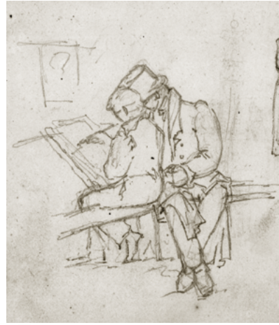
Uit een schetsboek van C.C. Huijsmans. De leraar geeft tekenles aan de leerling.