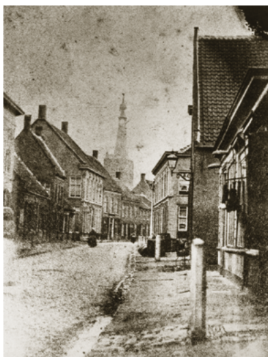
De Heuvelstraat in 1870.