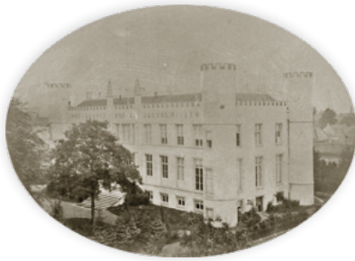
Het paleis als Rijks-HBS Koning Willem II in 1876.