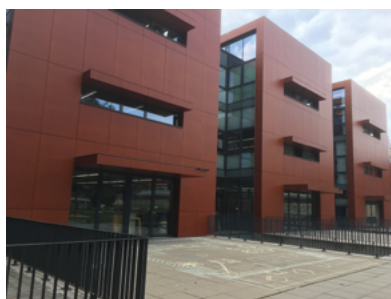
Fontys Hogeschool voor de Kunsten.