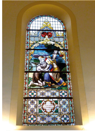
Gebrandschilderd raam in de Nederlands Hervormde kerk.

Links van de ingang van de kerk staat een klein bronzen beeldje, het Schrijvertje van Hein Koreman (1921) dat hier in 1989 is geplaatst.