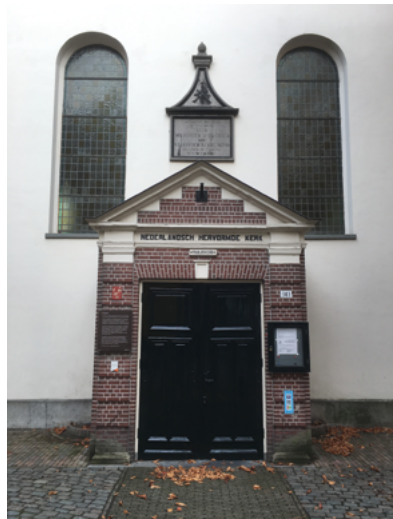
De Nederlands Hervormde Pauluskerk.