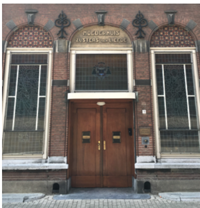
Het moederhuis van de Zusters van Liefde.