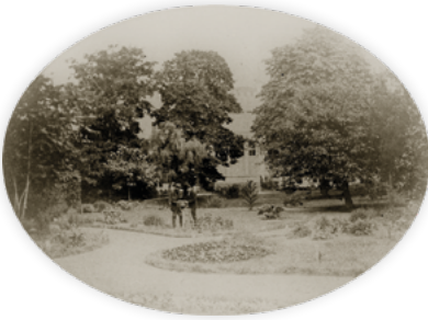
De botanische tuin aan de voorzijde van de HBS in 1876.

(Brief 394: aan zijn broer Theo van Gogh, Hoogeveen, vrijdag 12 oktober 1883)