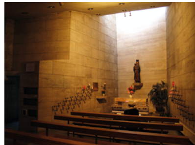
Mariabeeld in de kapel van O.L. Vrouw ter Nood.

In oktober 1944, toen het finale oorlogsgeweld Tilburg naderde, deden de Tilburgers een plechtige belofte. Zij beloofden 'na de oorlog mee te helpen aan de totstandkoming van de kapel aan een der hoofdstraten