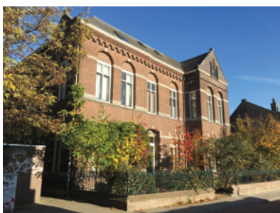
De voormalige pastorie van de parochie St. Anna, Capucijnenstraat 27.

Route: Steek bij de hoofdingang van de begraafplaats de Bredaseweg over en ga de Sint Annastraat in. Op het einde linksaf de Capucijnenstraat in.