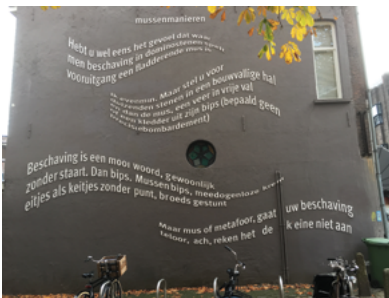
Plekgedicht op de zijgevel van Heuvelstraat 139.