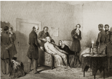
Het overlijden van koning Willem II met naast hem koningin Anna Paulowna, 17 maart 1849.

Aan de rechterzijde is in 2012 een enorm met vormvolgende wingerd begroeid kunstwerk in corten-staal opgesteld, de Maawmuur van kunstenares Miranda Poel (1972). Het werk bestaat uit grote stalen letters die samen de tekst 'Wie geen fouten maakt, maakt meestal niets' vormen.