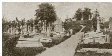
Begraafplaats aan de Bredaseweg omstreeks 1900.