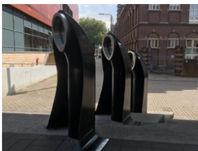
Zusters in staal door Judith Kuipers uit 2009.