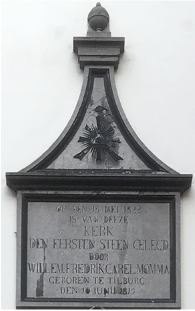
Boven de hoofdingang van de Nederlands Hervormde kerk hangt de eerste steen.