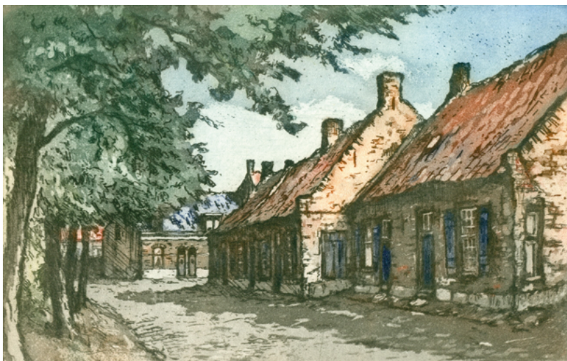
Weverwoning op het Goirke (thans Julianapark), ets door C. de Kort ca. 1950. In de tijd van Vincent stonden er honderden van dergelijke woningen.