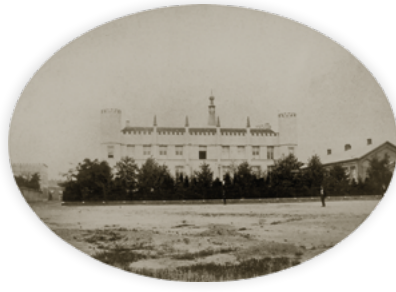
De achtergevel van de HBS met speelplaats in 1876.