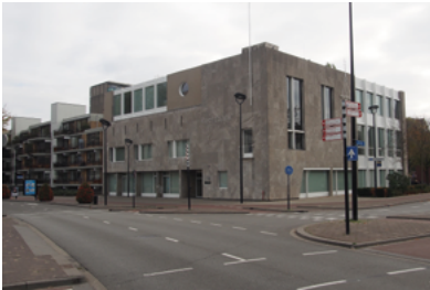
De Rechtbank.