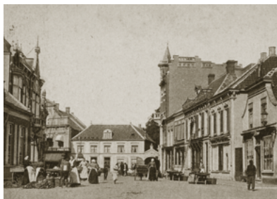
De Oude Markt in 1905.