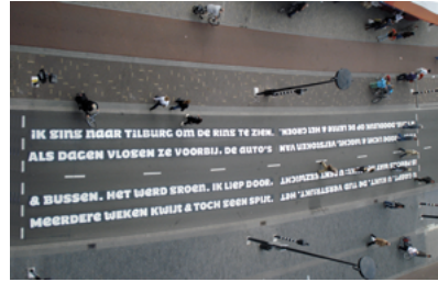
Plekgedicht bij de Katterug. (Foto Sander Neijns, 2009)

U gaapt. U kijkt. De tijd verstrijkt. Het is precies wat het lijkt: u bent gezwicht voor het rode licht & wacht verstoken van 'n tune doorleuk op de lente & het groen.