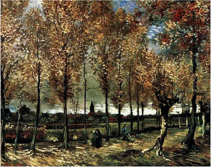
Vincent van Gogh, laan met populieren in Nuenen, 1885.