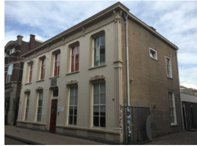
Nieuwlandstraat 44, in de tijd van Vincent van Gogh de pastorie van de Nederlands Hervormde Gemeente.

Nieuwlandstraat 44 , gebouwd in 1808, heeft een rijke geschiedenis. Hier werd op 27 mei 1818 prof. dr. F.C. Donders geboren. Hij was een beroemd oogheelkundige. In 1858 richtte hij het eerste Nederlandse ooglijders gasthuis te Utrecht op en werd er de eerste directeur en 'dirigerend-geneesheer'. Bij zijn aanvaarding van het hoogleraarsambt te Utrecht in 1848, sprak hij de belangwekkende rede De harmonie van het dierlijk leven, de openbaring van wetten uit, waarmee hij ruim tien jaar op Darwins On the Origin of Species vooruitliep. In 1888 legde Donders wegens het bereiken van de 70-jarige leeftijd zijn