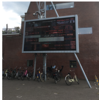
Kunstwerk Between You & Me.