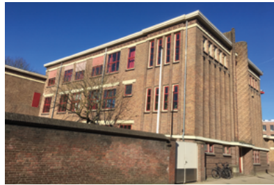
Het voormalige Theresialyceum, later Jozef Mavo.