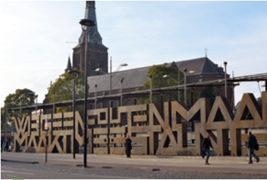
De Maawmuur.

Route: Loop langs het Paleis-Raadhuis in de richting van de Heikese kerk. Dit deel heet Willemsplein.