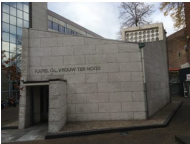
Kapel van O.L. Vrouw ter Nood in de Kapelhof.

Route: Ga op de Oude Markt voorbij de Schouburgpromenade linksaf naar de Kapelhof.