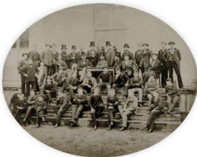
Docenten en leerlingen van de Rijks-HBS, 1866 of 1867. Vincent zit op de voorste rij, derde van links.

Brief 009: Vincent van Gogh aan zijn broer Theo van Gogh, Londen, 13 juni 1873.