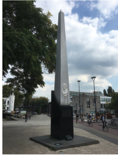
De nieuwe gedenknaald.