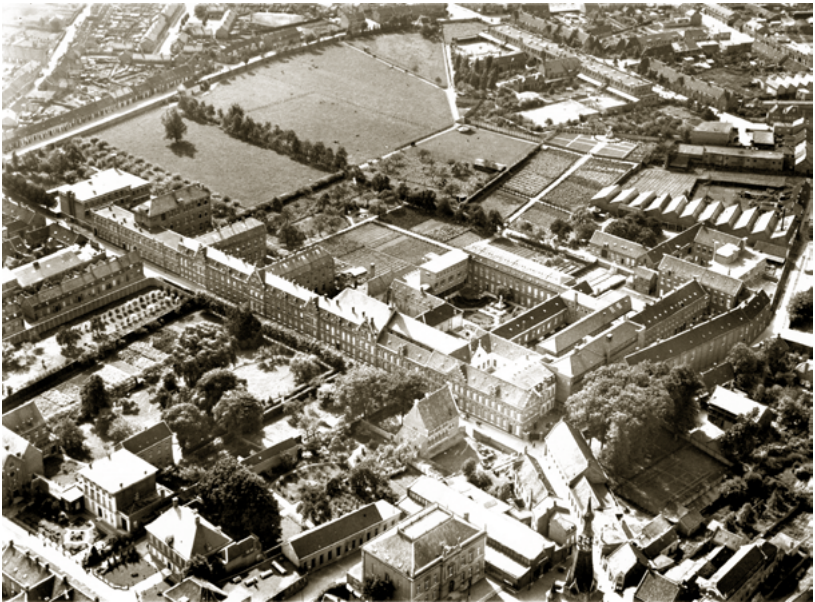
Luchtfoto uit 1932 van het klooster van de Zusters van Liefde aan de Oude Dijk. Naar rechtsboven de Kloosterstraat. Op de voorgrond het oude stadhuis aan de Markt. Achter het klooster de uitgestrekte landerijen en tuinen. Rechtsboven Huize Nazareth.