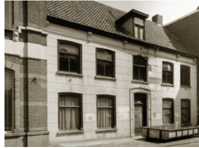
De oude pastorie ernaast, kort voor de sloop in 1989.