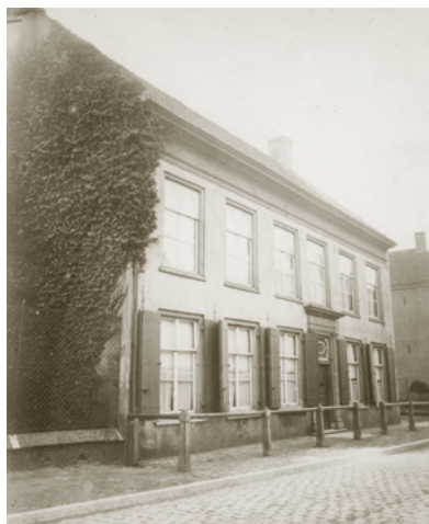
Het oude paleis dat kroonprins Willem in 1835 kocht van de weduwe van lakenverver J.M. Frankenhoff. Koning Willem II is in 1849 in dit huis overleden. De foto is kort voor de sloop in 1872 gemaakt.

de ingrijpende renovatie van Stadskantoor I (een ontwerp van Architectenbureau Kraayvanger), dat tegen het Paleis-raadhuis zal worden vast gebouwd.