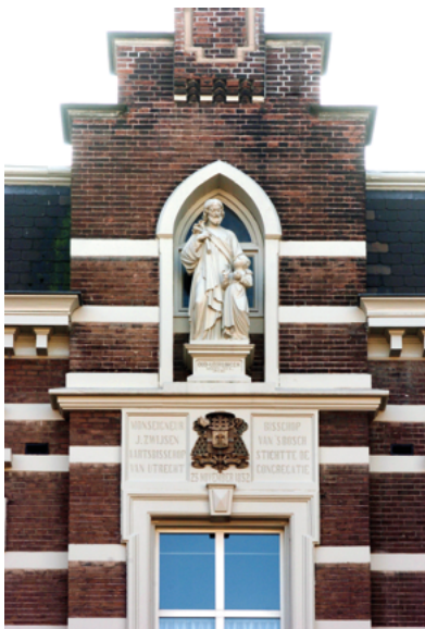
Het klooster aan de Kloosterstraat met beeld van St. Jozef en het bisschoppelijk wapen van Zwijssen.