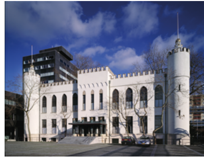
Paleis-Raadhuis in 2003.

als een uitmuntend tekenleraar. In de eerste klas werd vier uur en in de tweede klas drie uur lesgegeven in handtekenen. Vincent was geen slechte leerling. Bij zijn overgangsexamen in 1867 behaalde hij een puntengemiddelde van 7,36.