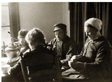
Open riool achter boerderij en aan de koffietafel in Tilburg ca. 1900.