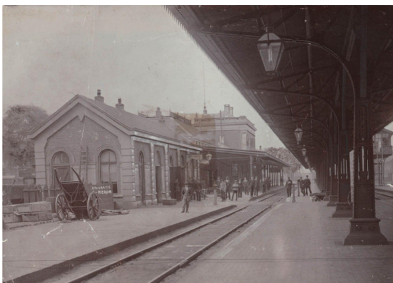
Het perron van het station in 1900. Hier stond Vincent vaak te wachten op zijn trein naar Breda. Vandaar liep hij te voet naar zijn ouderlijk huis in Zundert.