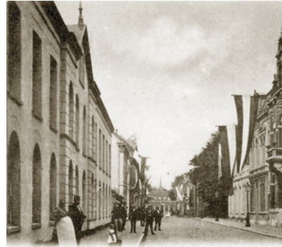
De Stationsstraat in 1901 met aan de linkerkzijde de wollenstoffenfabriek van Ledeboer.