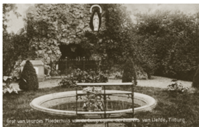
De Lourdesgrot in de tuin van de Zusters, 1910.