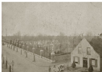
De oudst bekende foto van de begraafplaats aan de Bredaseweg, ca. 1890.

begraafplaats zijn veel bekende Tilburgers begraven, onder andere de in 1900 vermoorde Marietje Kessels.