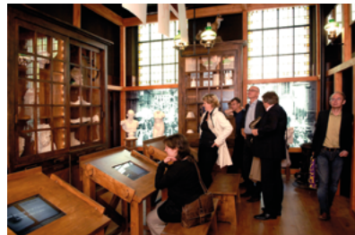
Vincents Tekenlokaal. (Foto's Jan Stads, 2009 en 2010)