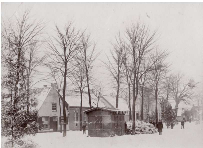
▼ Korvelplein in 1892 gezien in de richting van de Korvelseweg.