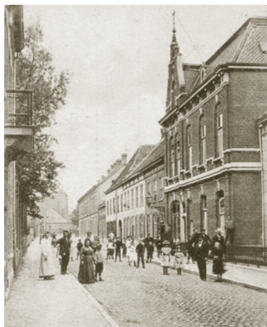
De Bisschop Zwijzenstraat in 1903 met geheel rechts het klooster van de Franciscanessen.