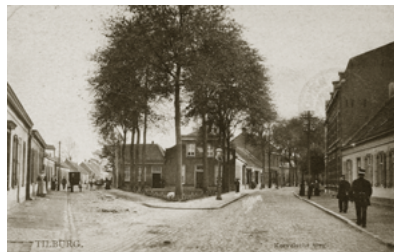
▼ Het Sint Annaplein in 1905. Naar links de Trouwlaan en naar rechts de Korvelseweg. Het begin ervan heette destijds het Haringseind. Bij de vrouw links het kosthuis van Vincent van Gogh.