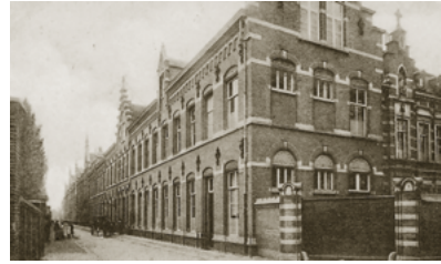
Het moederhuis van de Zusters van Liefde in 1930.

De lange gevelwand aan de Oude Dijk 1-9 is het klooster van de Zusters van Liefde .