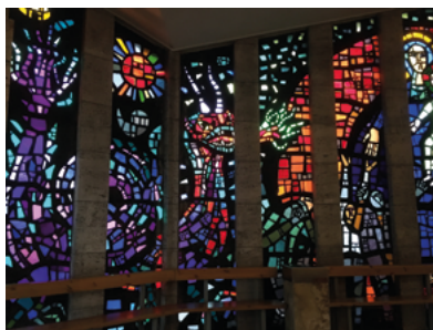
Glas-in-betonraam van Daan Wildschut in de kapel van O.L. Vrouw ter Nood.

De kleurrijke glas-in-betonramen werden vervaardigd door Daan Wildschut (1913-1995). In de kapel ligt een gekalligrafeerd boek met de namen van 314 Tilburgers die in de oorlog stierven. Van dit boek wordt dagelijks een pagina omgeslagen. Tevens bevinden zich er een 15-eeuws Madonnabeeld, geschonken door een Tilburger, en een gedenkteken ter ere