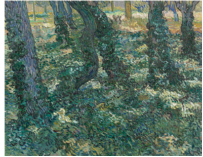
Vincent van Gogh tekende en schilderde vele bomen, o.a. in Nuenen (1884) en Saint Rémy (1889).