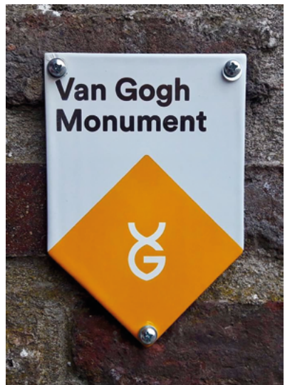
Sint Annplein anno 2017.