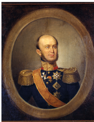
Koning Willem II