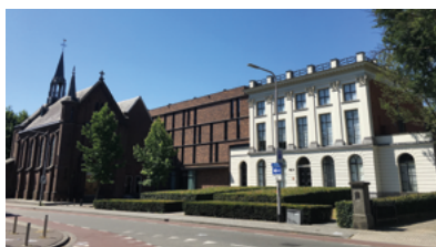
▼ Bisschop Zwijsenstraat 24, 26, 28 en 30.