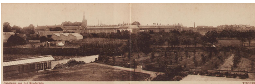
Panoramafoto van het kloostercomplex met de tuinen van de Zusters van Liefde, 1930.