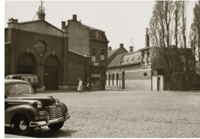
De Philharmonie (bij de bomen). De boterhal (links) werd in 1888 gebouwd. Foto 1954.

In de tijd van Vincent van Gogh stond ongeveer op deze plaats het gebouw van de sociëteit Philharmonie. Deze gezelligheidsclub werd in 1840 voor de elite van de stad opgericht. Het gebouw moest wijken voor de aanleg van de schouwburg.