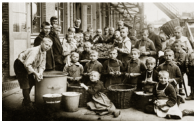
Fraters met pupillen bij Huize Nazareth in 1923.

Aan de linkerkzijde staat het vroegere voogdijgesticht Huize Nazareth . Dit internaat voor 'verlaten en misdeelde kinderen' is in 1916 opgericht door de congregatie van de Fraters van Tilburg. Dit complex is een ontwerp van architect Jos. Donders (1898-1940). Het 140 meter lange gebouw omvatte een eigen kapel, een recreatiezaal, een tuin, sportvelden, een openluchttheater en een school voor bijzonder lager onderwijs.