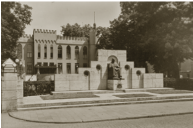
De oorspronkelijke locatie van het monument van mgr. J. Zwijsen voor het Paleis-Raadhuis in 1946.