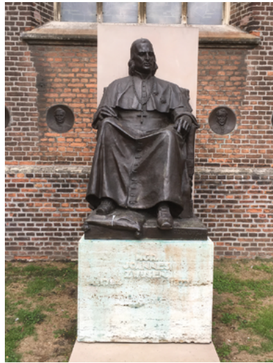
Standbeeld van mgr. J. Zwijsen.