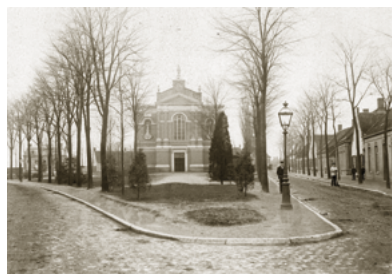
Korvelplein in 1892 met midden op het plein nog de oude kerk, ontworpen door architect Hendrik van Tulder in 1851, zoals Vincent deze gekend moet hebben.